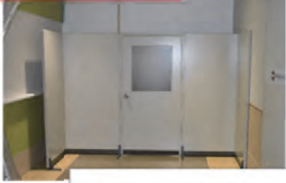
扉付き隔壁の設置