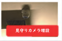
見守りカメラ増設