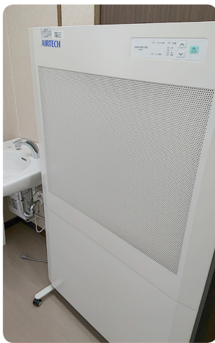
陰圧パーテーション