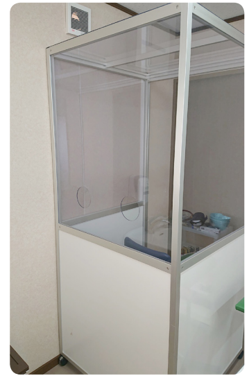
検体採取ボックス